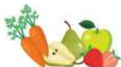
ФРУКТЫ И ОВОЩИ