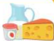
МОЛОКО, ЙОГУРТ И СЫР